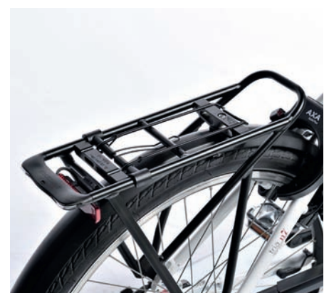
Racktime Gepäckträger für 25 Kilo Last mit integriertem Rücklicht.